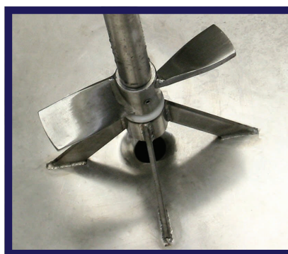
Particolare elica e scarico di fondo