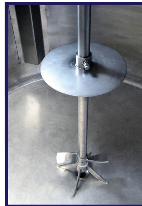
Particolare agitatore, disco rompi-vortice sull'asse e pale frangi-flutti alle pareti