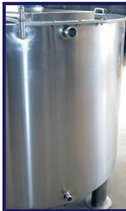
Attacchi per circuito intercapedine e valvola di sfiato superiore

Miscelatore/dissolvente in acciaio inossidabile, agitatore con frangiflutti alle pareti (ad elica veloce con disco frangi-vortice sull'asse o con pale lente), sportelli superiori in due metà con chiusura igienica, scambiatore di calore ad intercapedine con circuito elicoidale