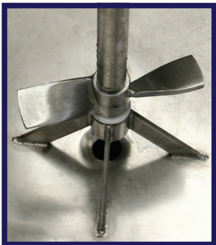
Elica veloce a due pale