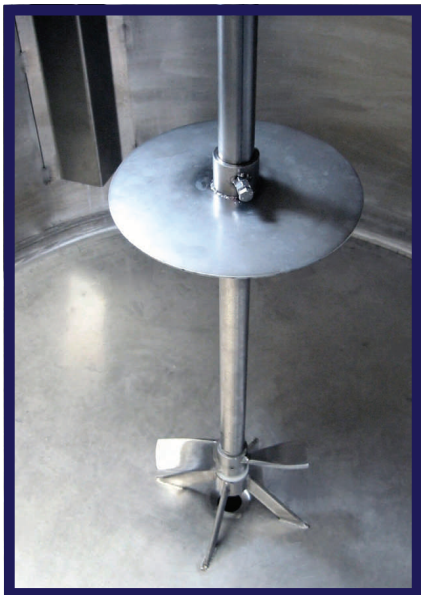
Disco rompi-vortice regolabile sull'asse