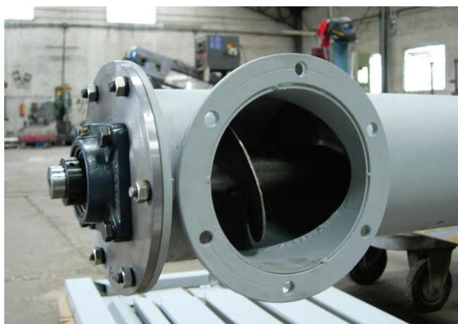
Raccordo coclea verticale supporto o a cuscinetto