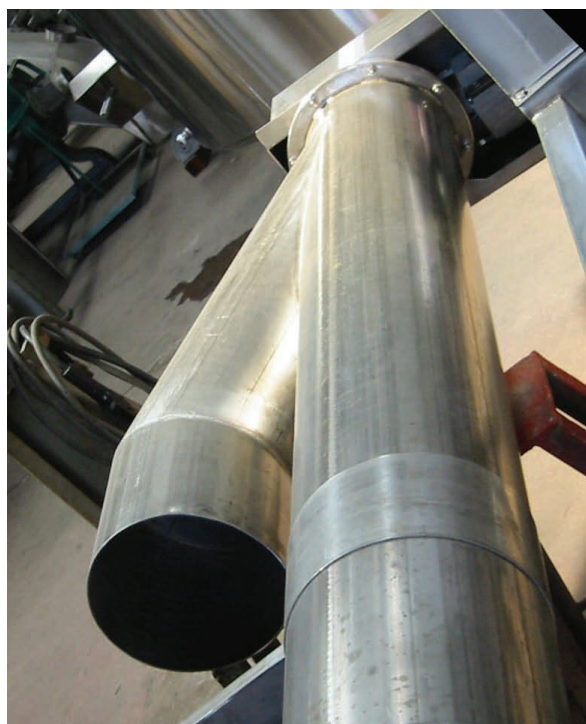
Coclea verticale, Bocca di scarico