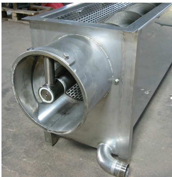
Coclea sgrondatrice, scarico con supporto