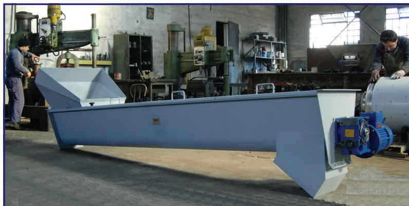
Coclea a canale di miscelazione