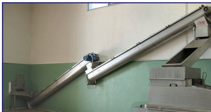
Coclee di trasporto