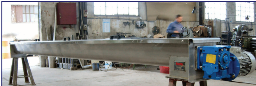
Coclea a canale di trasporto