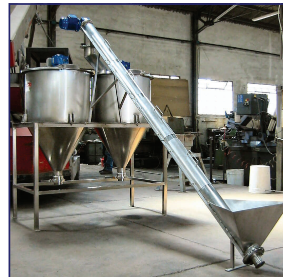
Coclea di alimentazione