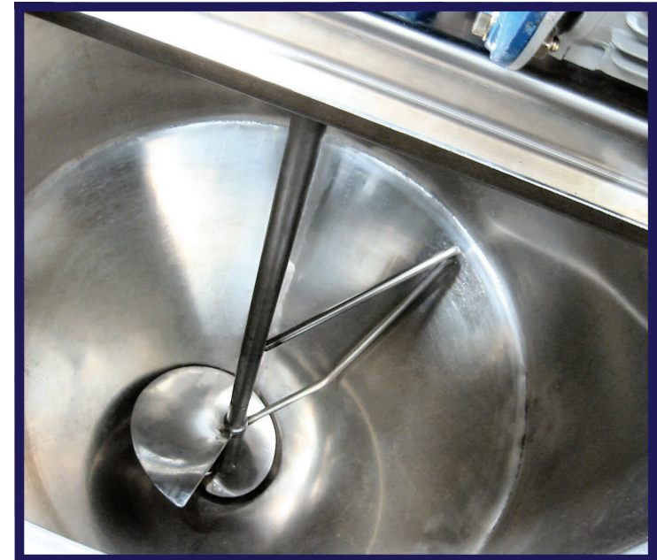
Particolare interno con aspo e coclea conica