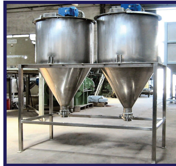
Vista due tramogge accoppiate